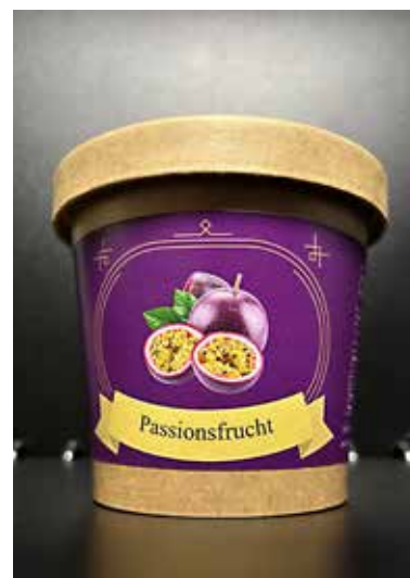
Handgefertigte Schokoladenkugeln mit flüssigem Fruchtkern.

Himbeere, das Team hat so lange am Rezept gefeilt, bis der Mix perfekt war. Der grösste Lerneffekt? «Wir mussten erst einmal investieren, ohne zu wissen, ob die Produkte ankommen. Diese Unsicherheit war einschüchternd, aber der Mut hat sich ausgezahlt», so die jungen Gründer.