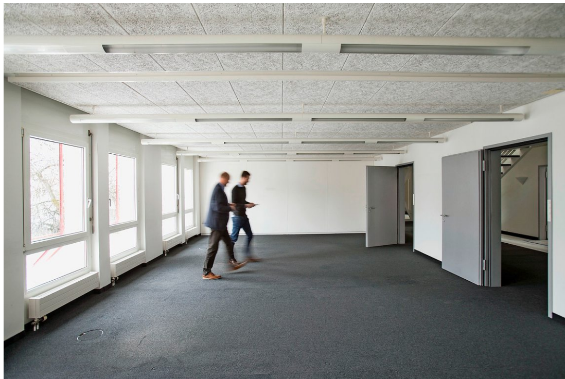
Ein Rundgang gab Einblick in die künftigen Schulzimmer der Kanti Zimmerberg.

Damit sich das dreigeschossige, u-förmige Bürogebäude mit der markanten Glasfront in eine Schule verwandelt, wird ab nächstem August gebaut. Im Parterre entstehen Physik- und Chemieablässe sowie Musikzimmer. Ein Saal in der Hausmitte wird als Aula dienen, in der rund 120 Personen Platz finden. Und ein anderer grösserer Raum, wo zurzeit noch ein mit Marmor eingekleidetes Cheminée eingebaut ist, wird zur Mensa umfunktioniert. Am Waldrand hinter dem Haus entsteht ausserdem ein Hartplatz für den Sportunterricht. Eine Turnhalle gibt es nicht. Doch man sei im Gespräch